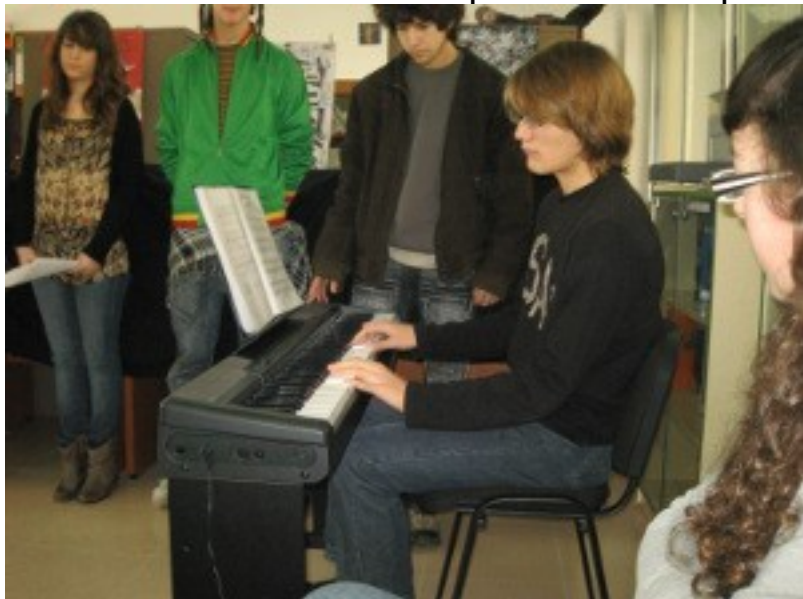
Els 10minutets de música, aquesta vegada de piano.