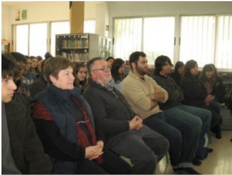
El públic escolta recitar ben atent